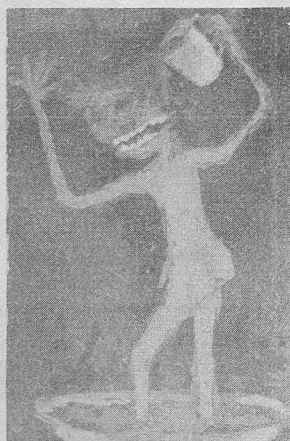
Veloni, linguagem animalista.