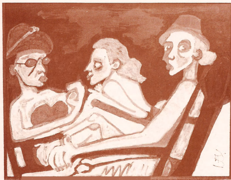
Ney Machado "Figuras na Praia"

De 10 de novembro a 02 de dezembro de 1995